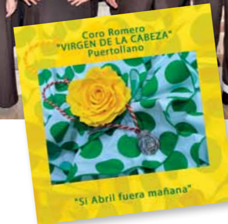
Portada del primer disco editado por el Coro Romero Virgen de la Cabeza de Puertollano.