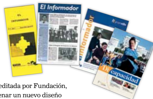
Evolución gráfica de la revista desde sus inicios.

En el número 100 de la revista editada por Fundación, Grupo SIFU ha decidido estrenar un nuevo diseño acorde con la nueva línea gráfica que ha adquirido la organización. Además, ha querido incluir nuevos apartados que acercan al lector el trabajo y la visión de los empleados, así como información de actualidad sobre el sector.