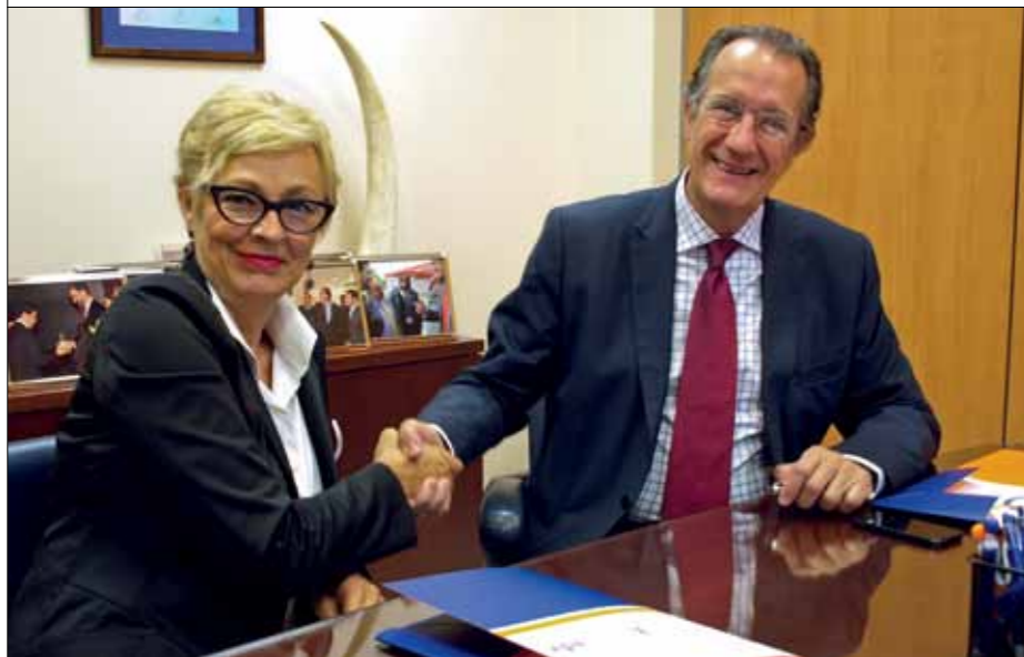
El presidente de Fundación Grupo SIFU, en la firma del acuerdo de colaboración con Fundación Tot Raval.