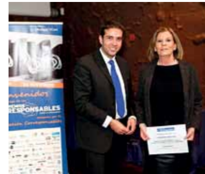
Fundación Grupo SIFU, finalista en la categoría de Entidades grandes sin ánimo de lucro.

Accede al videoclip de la canción Lo puedo conseguir .