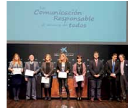
Foto de grupo de los galardonados en los IV Premios Corresponsables.